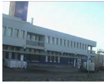
Odgrzybianie i impregnacja zapobiegająca zagrzybieniu / Gdańsk /