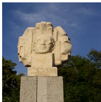
Renowacja pomnika w Kościerzynie