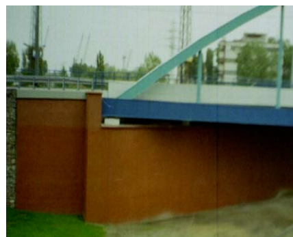
Oczyszczenie cegły licówki z wykwitów wapiennych i impregnacja hydrofobowa / Most w Gdyni /