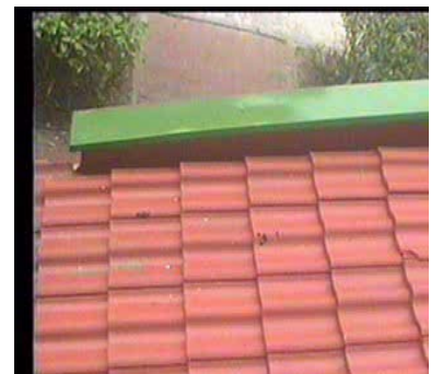
odgrzybianie, czyszczenie dachówek / Gdynia /