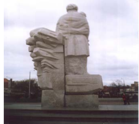
Usuwanie graffiti, oczyszczenie i zabezpieczenie przed graffiti pomnika w Kościerzynie