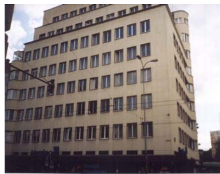
oczyszczenie płyt wapiennych elewacji budynku w Gdyni