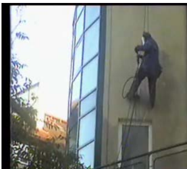
Prace technikami alpinistycznymi