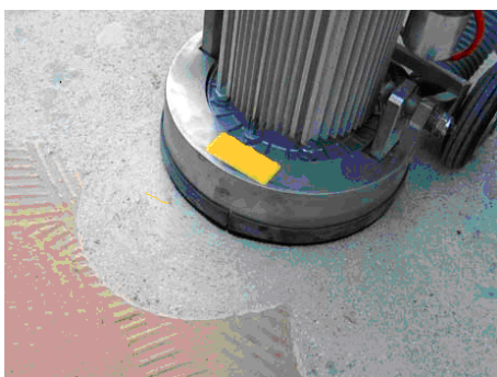
usuwanie kleju, wyrównywanie