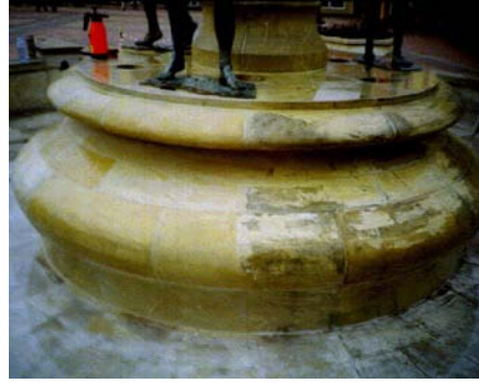
Odgrzybianie i oczyszczenie piaskowca / Chojnice /